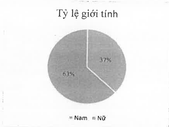
Biểu đồ 1: Tỷ lệ giới tính và tỷ lệ sử dụng bảo hiểm