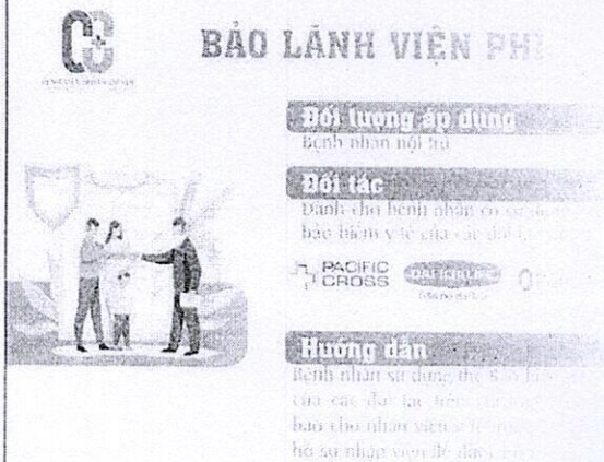
Hình 4: Bảo lãnh viện phí