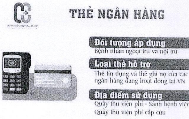
Hình 1: Thẻ ngân hàng